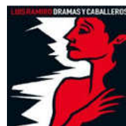
luis ramiro dramas y caballeros