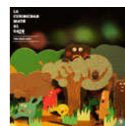
two dead cats la curiosidad mató al gato