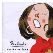
deolinda canção ao lado