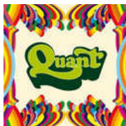
quant new adventures in full color