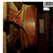
the joe-k plan Rigan asesino, OLibia vencerá