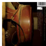
the joe-k plan Rigan asesino, OLibia vencerá