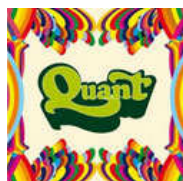
quant new adventures in full color