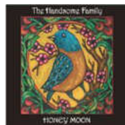
the handsome family honey moon